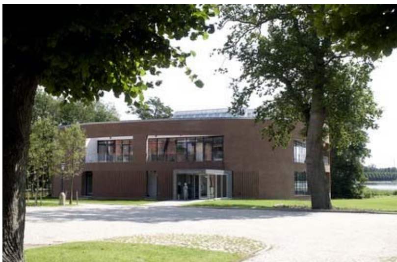
Mærsk Mc-Kinney Møller videncenter i Sorø.