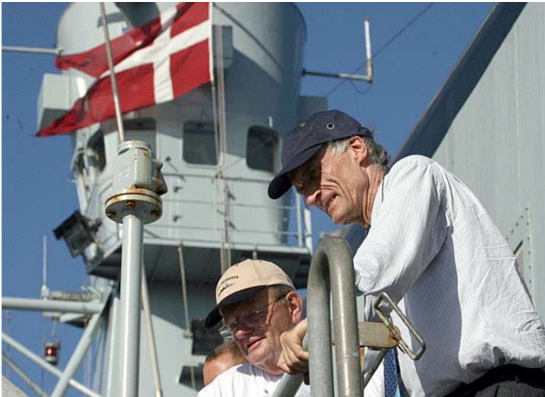
Undervisningsminister Bertel Haarder sejlede med "Vædderen" fra Accra i Ghana til Cape Town i Sydafrika i oktober 2006. På konferencen præsenterede han "Virtuel Galathea 3", der er et nyt undervisningsite for elever i folkeskolen og gymnasiet.